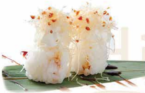
338. Tamarizushi philadelphia allergeni: 1,7,113