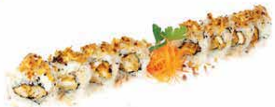
377. Chicken roll (pollo fritto, insalata, spicy mayo) 8 pz allergeni: 1,3