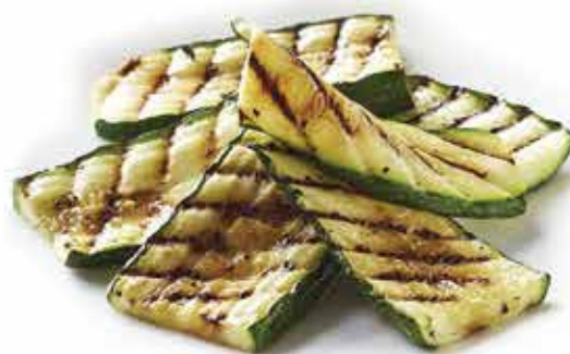
232. Zucchine alla griglia 🌿