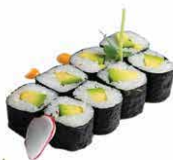
365. Hosomaki avocado 8 pz