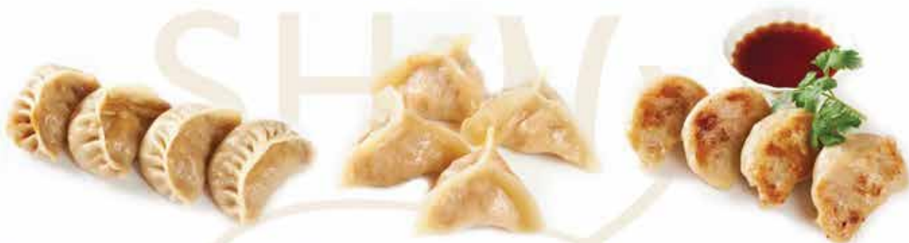
2. Ravioli di carne (4 pz) allergeni: 1*