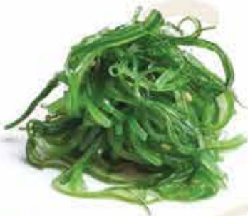
10. Goma wakame 🌿 (alghе croccanti leggermente piccanti) allergeni: 11*