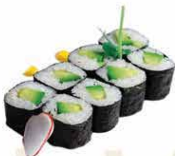
364. Hosomaki cetriolo 8 pz