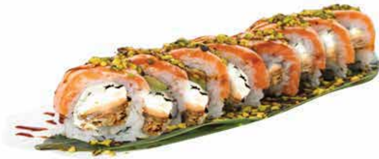
386. Super salmon roll (salmone alla griglia, philadelphia, guarnito con salmone, teriyaki e granella di pistacchio) 8 pz allergeni: 1,4,6,7,8,11