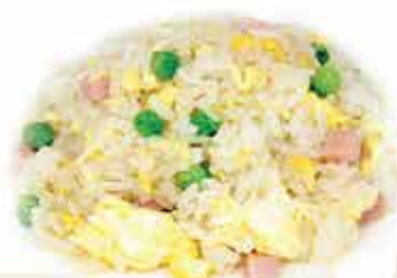
172. Riso cantonese allergeni: 1,3