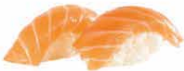
300. Salmone allergeni: 1,2*