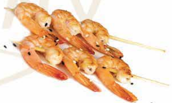
194. Spiedini di gamberi max 1 porzione allergeni: 2*