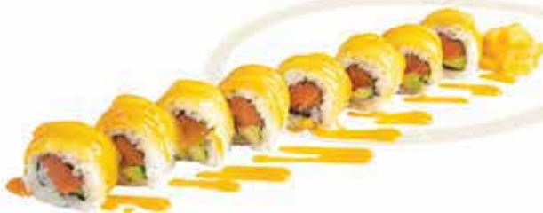
374. Mango roll (salmone, mango, philadelphia, salsa mango) 8 pz allergeni: 4,7,11