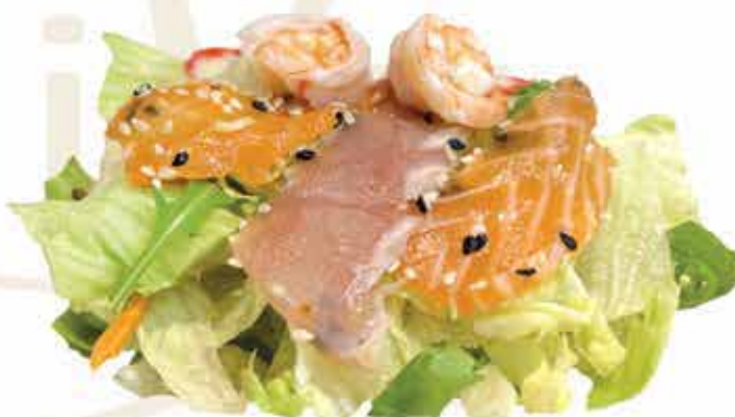
24. Rainbow salad (insalata mista con pesce misto e salsa sesamo) allergeni: 2,6,9,11