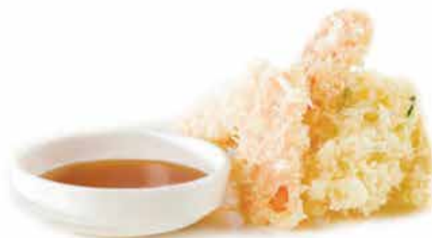
182. Yasai tempura 🌱 (verdure miste fritte) allergeni: 1,3