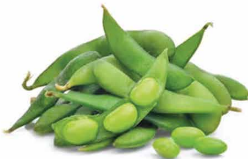
5. Edamame 🌿 (Baccelli di soia) allergeni: 6*