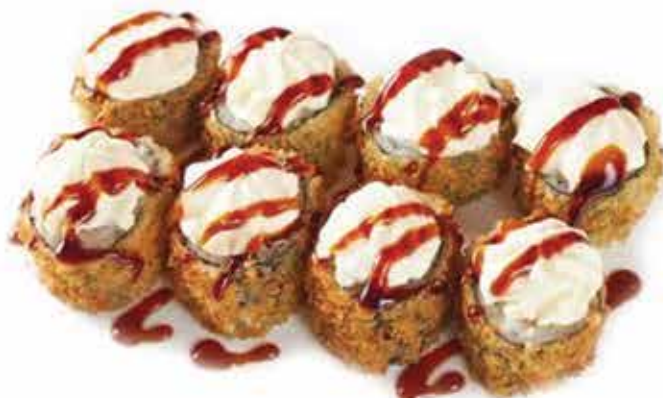
360. Maki fritto philadelphia (salmone, teriyaki, philadelphia) 8 pz allergeni: 1,4,6,7,11