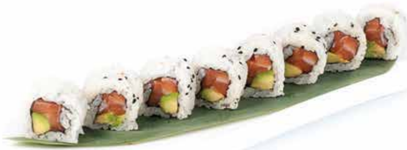
369. Uramaki salmone, avocado 8 pz allergeni: 4,11