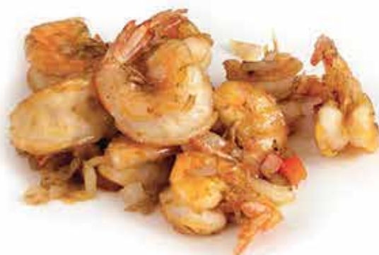
233. Gamberi sale e pepe max 1 porzione allergeni: 1,2*