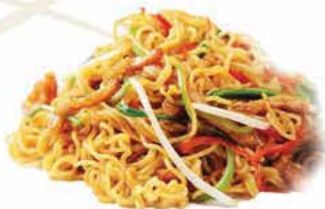
163. Spicy Ramen ) (pollo, verdure e salsa piccante) allergeni: 1,3