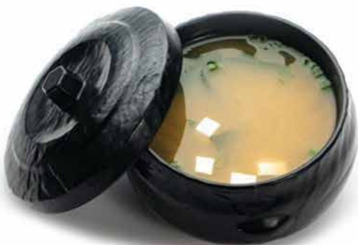
25. Zuppa di miso 🌿 (alghe, tofu, erba cipollina) allergeni: 6