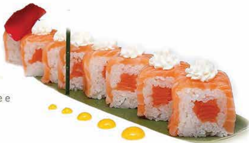
404. Fresh salmone (roll farcito con salmone e philadelphia guarnito con salmone 8 pz) allergeni: 1,4,7,11