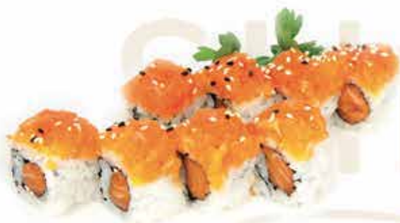
401. Salmon roll (salmone all'interno, guarnito da fette di salmone e salsa teriyaki) 8 pz allergeni: 1,4,6,11