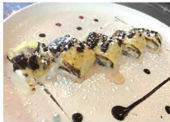
Crep alla nutella con gelato di riso € 5.50 (home made)