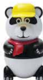
Pan Dan Gelato al gusto vaniglia € 5.00