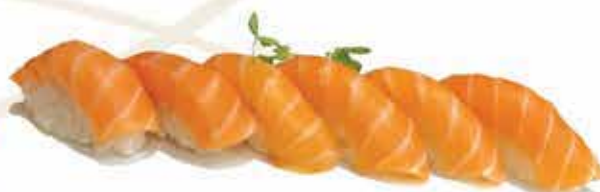
308. Sushi sake 6 pz (nigiri solo salmone) allergeni: 4