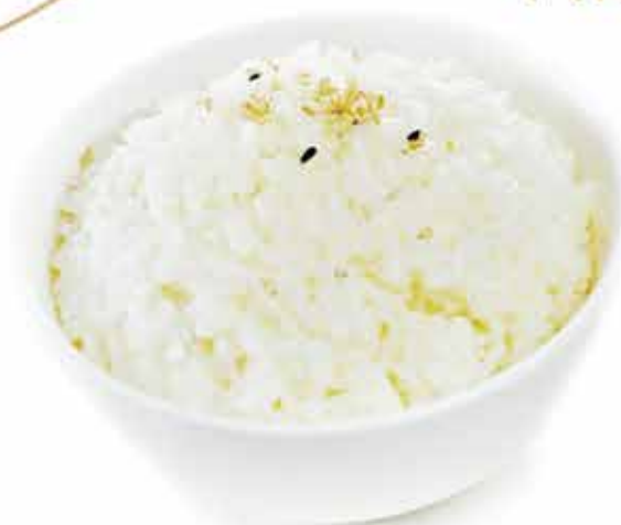
170. Riso bianco