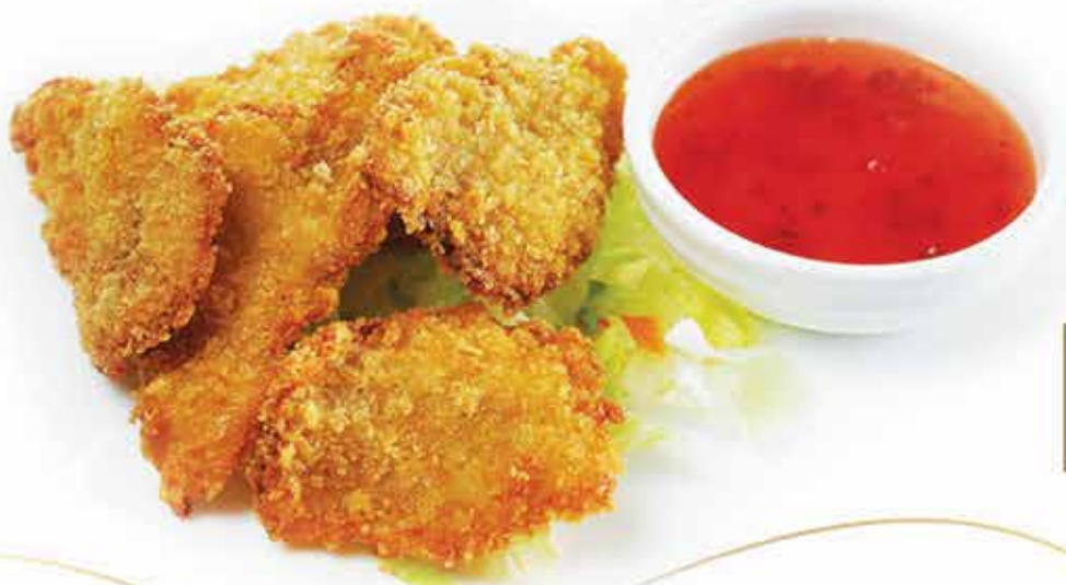
217. Pollo fritto allergeni: 1,3+