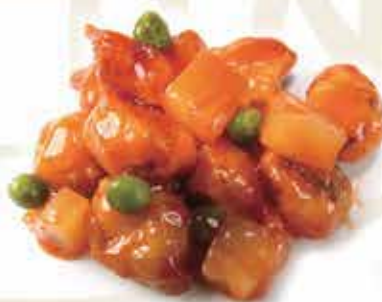
214. Pollo in agrodolce allergeni: 1,6*