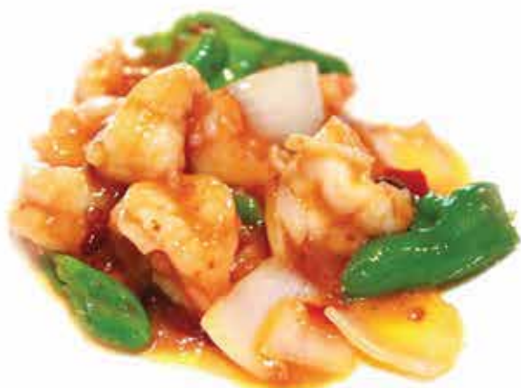
229. Gamberi spicy 🌶️ max 1 porzione allergeni: 1,2*