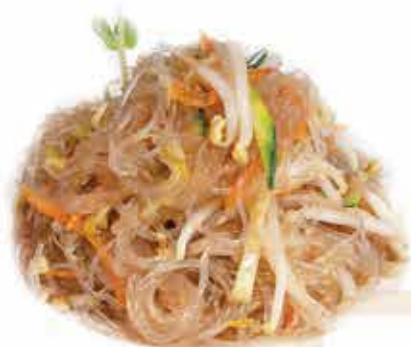
162. Spaghetti di soia con verdure miste 🌱 allergeni: 1,6