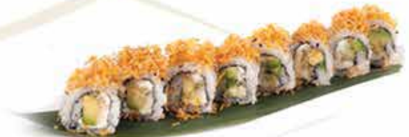
393. Green roll (avocado, cetriolo, philadelphia, tempura croccante e teriyaki) 8 pz allergeni: 1,6,7,11