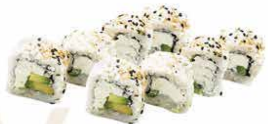
390. Uramaki avocado e philadelphia 8 pz 🌿 allergeni: 7,11