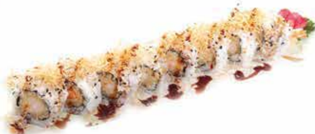
376. Ebiten maki (gambero fritto, maionese, teriyaki, tempura croccante) 8 pz allergeni: 1,2,3,5,11*