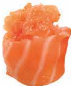
327. Gunkan spicy salmon) allergeni: 4,11