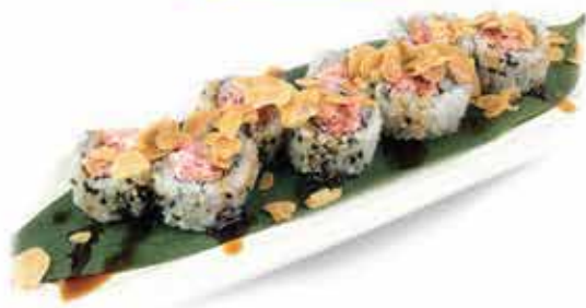
379. Uramaki star roll (salmone, philadelphia, teriyaki, scaglie di mandorle) 8 pz allergeni: 1,4,6,7,8,11