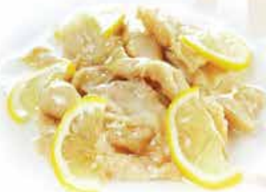
213. Pollo al limone allergeni: 1*