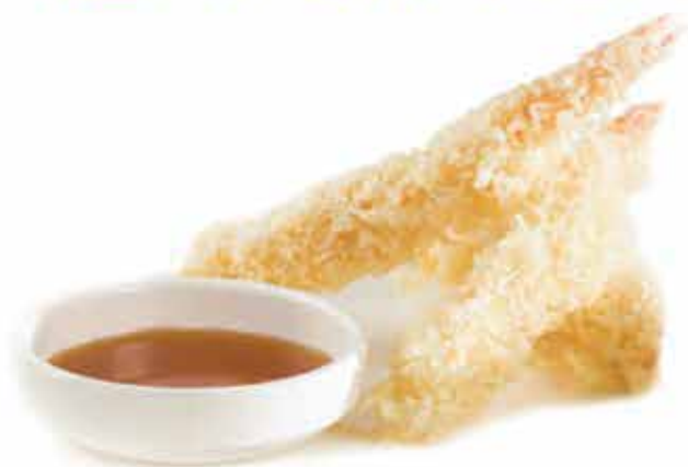
181. Ebi tempura (gamberoni fritti) allergeni: 1,2,3+