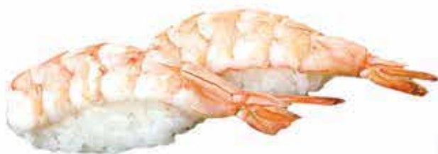
303. Gambero cotto allergeni: 1,2*