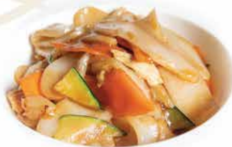
175. Gnocchi di riso con gamberi e verdure allergeni: 1,2,3