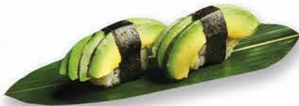
304. Avocado 🌿