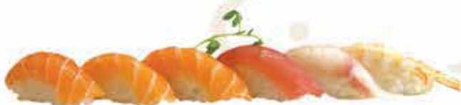
307. Sushi misto nigiri 6 pz (salmone, tonno, branzino, gambero cotto) allergeni: 2,4