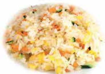
171. Riso saltato alle verdure allergeni: 1,3