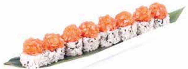
388. Uramaki spicy salmon (tartare di salmone piccante) 8 pz allergeni: 1,4,11