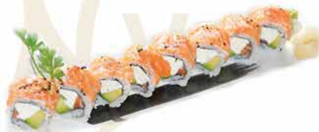
402. Uramaki sake speciale (salmone, avocado, philadelphia, guarnito da salmone) 8 pz allergeni: 1,4,6,7,11