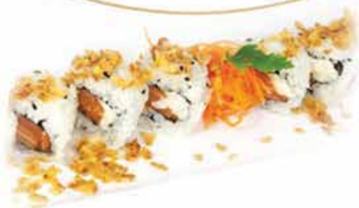
400. Onion roll (salmone, philadelphia, cipolla croccante, teriyaki) 8 pz allergeni: 1,4,6,7,11