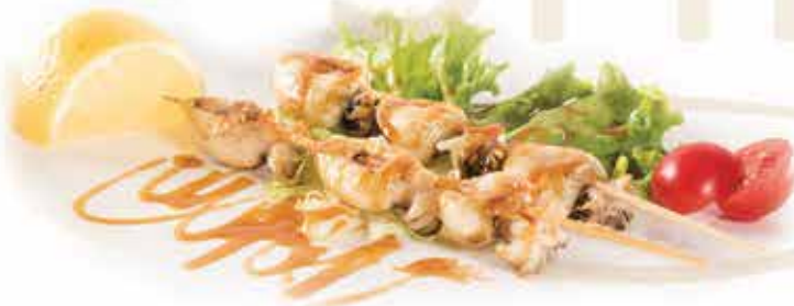
195. Spiedini di seppie allergeni: 14*