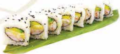
375. Uramaki ebi (gambero cotto, avocado, philadelphia) 8 pz allergeni: 2,7,11*