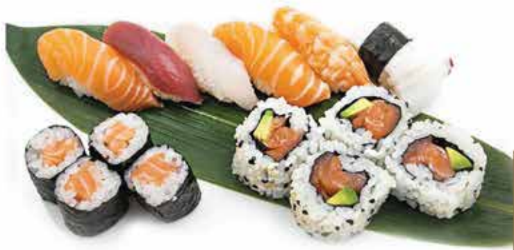
309. Sushi misto piccolo 13 pz (nigiri, uramaki, hosomaki) allergeni: 1,2,8,11