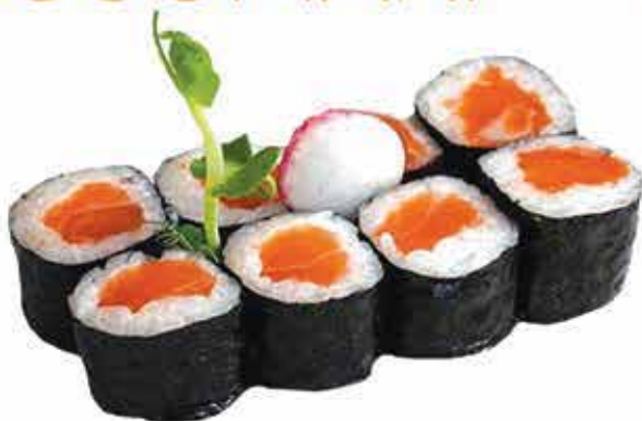
362. Hosomaki salmone 8 pz allergeni: 4