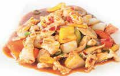
220. Pollo spicy ) allergeni: 1,6*