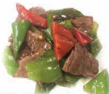
222. Manzo saltato con cipolla e peperoni allergeni: 1,6*