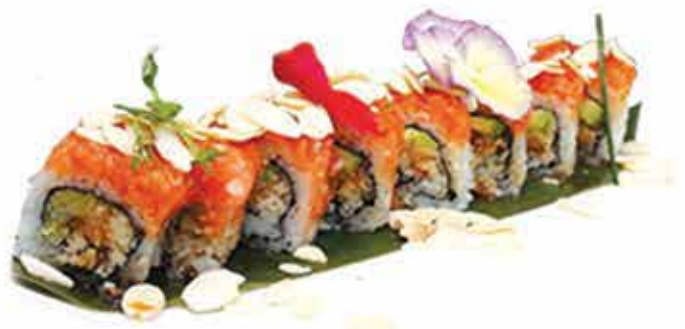
398. Uramaki special shiny (scaglie di tempura, avocado, philadelphia, ricoperto da tartare salmone e teriyaki) 8 pz allergeni: 1,4,6,7,11