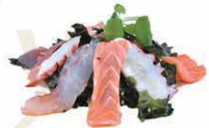
12. Wakame moriwase (alghе morbide ricoperto di pesce) allergeni: 1,2,9,11,14