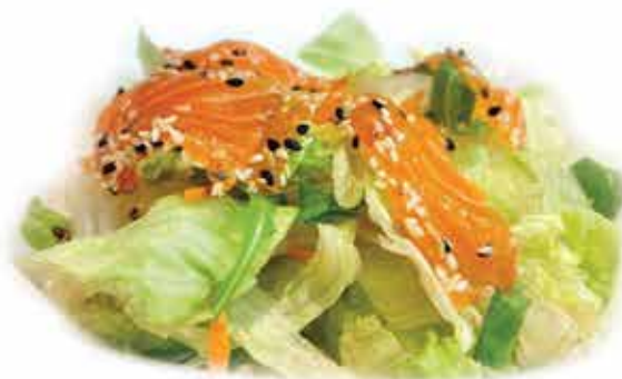
21. Shiromi salad (insalata mista con salmone, avocado e salsa sesamo) allergeni: 9,6,11