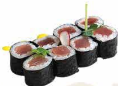
363. Hosomaki tonno 8 pz allergeni: 4