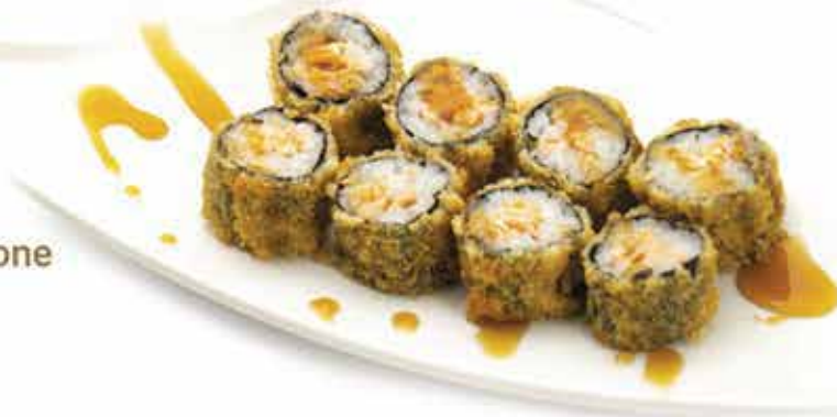
366. Hosomaki Fritto salmone (salmone, teriyaki) 8 pz allergeni: 1,4,6,7,11