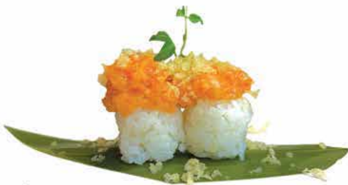
336. Tamarizushi salmone allergeni: 1,4,11

(BOCCONCINI DI RISO COPERTO DA PESCE E TEMPURA 2 PZ)