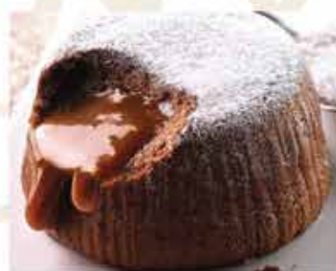
Soufflé al cioccolato nero € 5.00