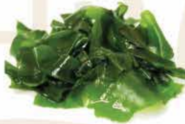
11. Wakame 🌿 (alghе morbide in salsa sesamo) allergeni: 1,9,11