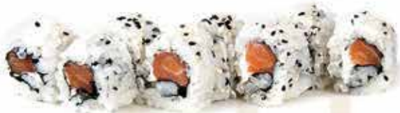
371. Uramaki philadelphia (salmone, philadelphia) 8 pz allergeni: 4,7,11