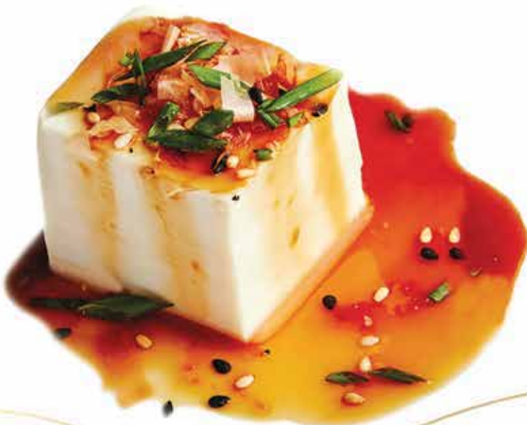
13. Tofu fresco in salsa ponzu 🌿 allergeni: 1,6