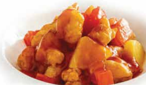
210. Maiale in agrodolce allergeni: 1*