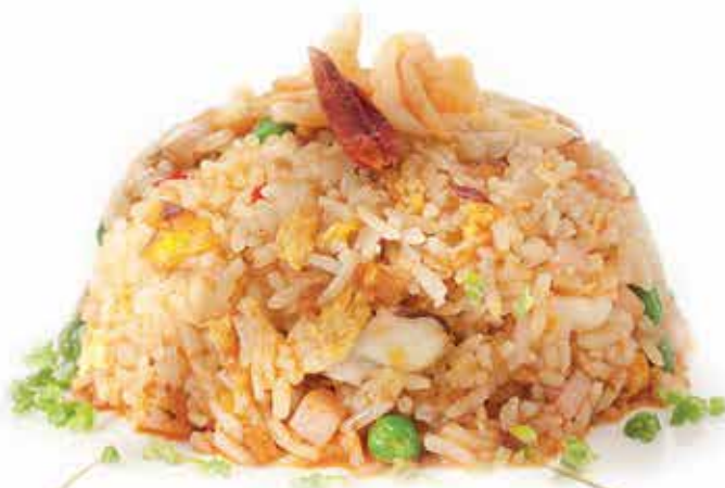
177. Riso alla pechinese ) (pollo, verdure, salsa piccante) allergeni: 1,3