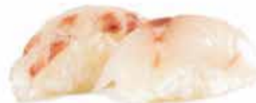
302. Branzino allergeni: 1,2*