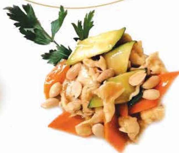
211. Pollo alle mandorle e verdure allergeni: 1,8*