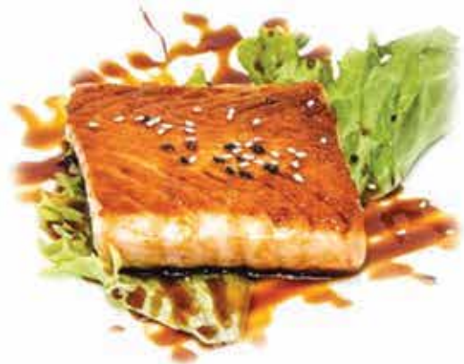
193. Salmone alla piastra con salsa teriyaki max 1 porzione allergeni: 4,6