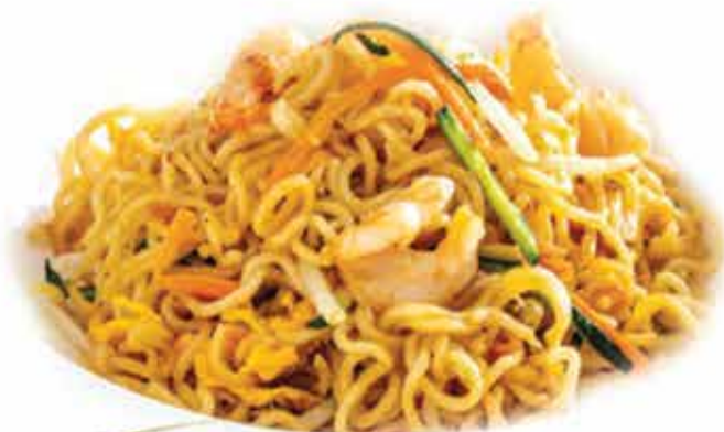
166. Chicken Ramen (con pollo e verdure) allergeni: 1,3