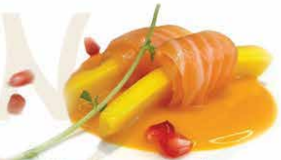
325. Involtini di mango (3 pz) (mango fresco avvolto da carpaccio di salmone e salsa mango) max 1 porzione allergeni: 4