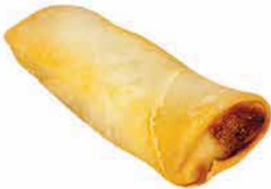
6. Harumaki 🌿 (involtino primavera con verdure miste 1 pz) allergeni: 1*