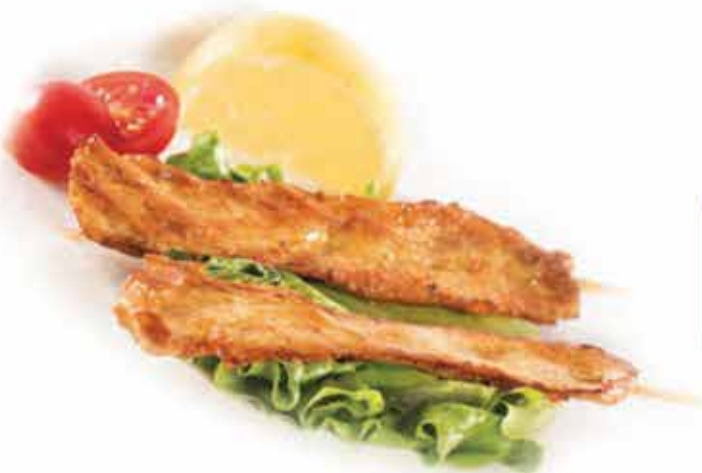
199. Spiedini di pollo alla piastra