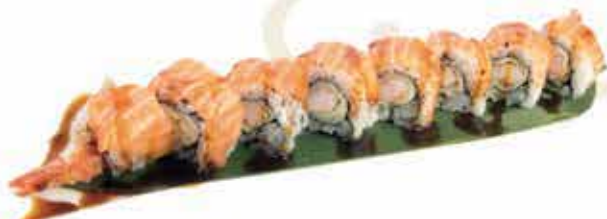
383. Tiger roll (gamberi in tempura, insalata, maionese, guarnito con salmone, teriyaki) 8 pz allergeni: 1,2,3,4,6,11*