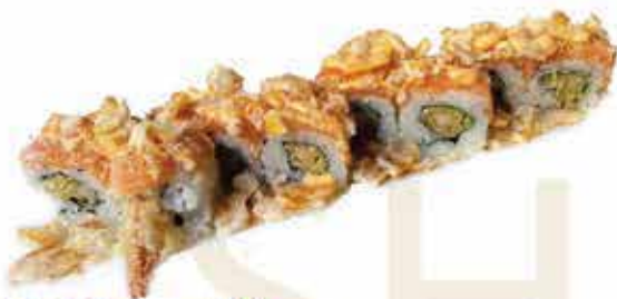
387. Mexx roll (gamberi in tempura, ricoperto con salmone, nachos, e salsa messicana) 8 pz allergeni: 1,2,4,11*