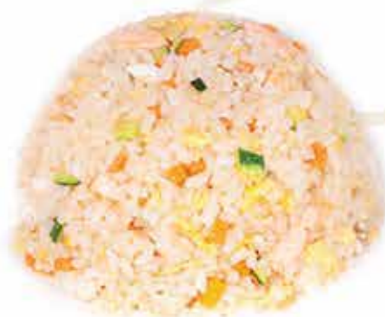
174. Riso saltato con salmone e verdure allergeni: 1,3,4