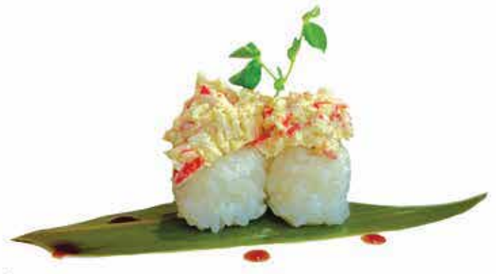
337. Tamarizushi crab allergeni: 1,2,11