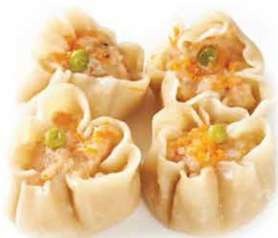
1. Ravioli di gamberi (Gambero verdure e carne 4 pz) allergeni: 1,2,3*