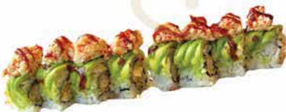
392. Ebiten plus (gamberi in tempura, guarnito da tartare di granchio, strutto, avocado e teriyaki) 8 pz allergeni: 1,2,6,11*