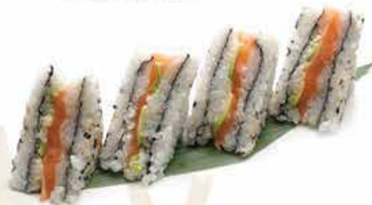
382. Uramaki sandwich (salmone, philadelphia, avocado, teriyaki, tempura croccante) 4 pz allergeni: 1,4,6,7,11