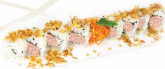
385. Miura crunch (salmone cotto, philadelphia, teriyaki, spicy mayo e granella di tempura) 8 pz allergeni: 1,4,6,7,11