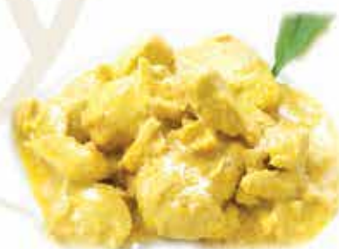
215. Pollo al curry allergeni: 1*