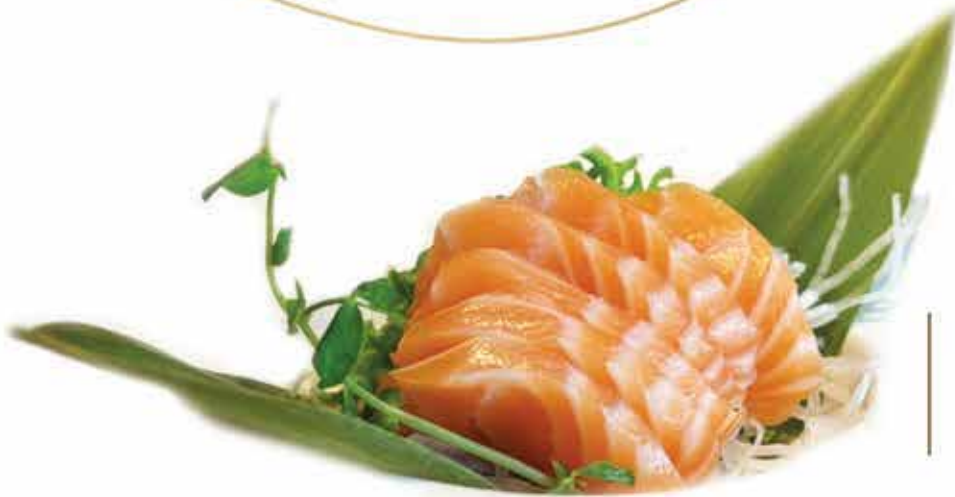
316. Sashimi salmone max 1 porzione allergeni: 4