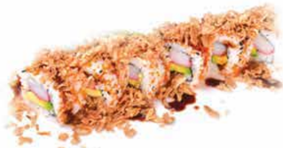
378. Crunch roll (granchio, avocado, maionese, cipolla croccante) 8 pz allergeni: 1,2,3,11