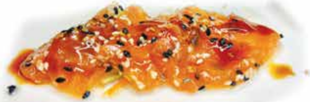
190. Salmon tataki (salmone scottato in crosta al sesamo, teriyaki e lime) max 1 porzione allergeni: 1,4,11