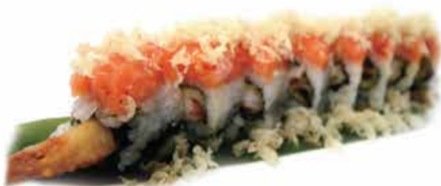
399. Uramaki spicy ebiten ) (gamberi* in tempura, guarnito da tartare di salmone piccante) 8 pz allergeni: 1,2,4,11*