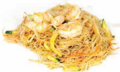
165. Spaghetti di riso con gamberi e verdure allergeni: 1,2,3*