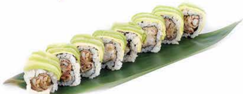
373. Uramaki miura (salmone alla griglia, philadelphia, teryaki, avocado all'esterno) 8 pz allergeni: 1,4,7,11