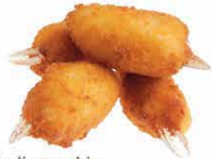
9. Chele di granchio allergeni: 1,2*