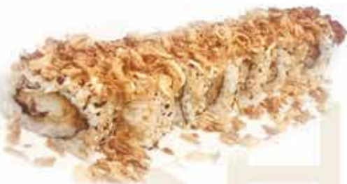
381. Uramaki ebiten special (gamberi fritti, philadelphia, cipolla croccante, teriyaki) 8 pz allergeni: 1,2,6,7,11*