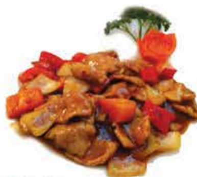
223. Manzo spicy ) allergeni: 1,6*