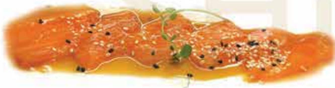
320. Carpaccio salmone con salsa ponzu max 1 porzione allergeni: 4,6,11