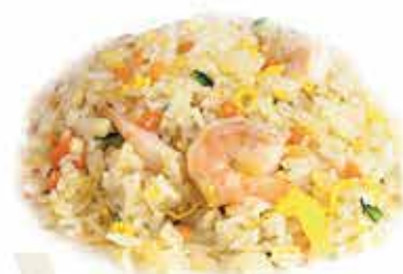
173. Riso saltato con gamberi e verdure allergeni: 1,2,3*