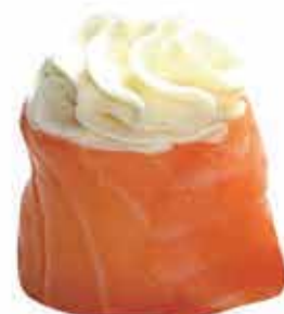
329. Gunkan philadelphia allergeni: 4,7