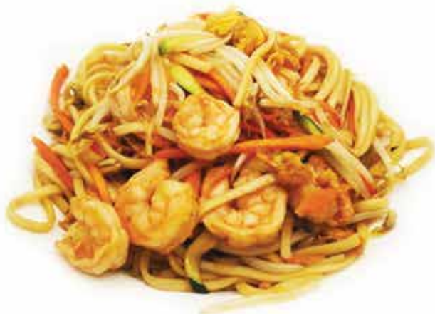
160. Yaki udon (spaghetti di grano con gamberi e verdure) allergeni: 1,2,3*