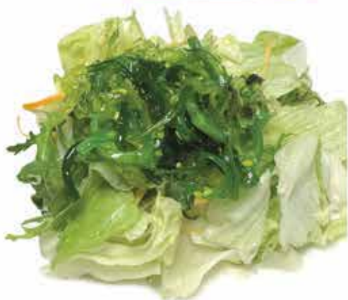
20. Crunch Salad 🌿 (insalata mista, alghe, goma wakame, salsa sesamo) allergeni: 6,9,11