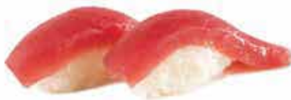
301. Tonno allergeni: 1,2*