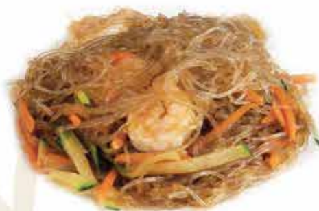
164. Spaghetti di soia con gamberi e verdure allergeni: 1,2,3,6*