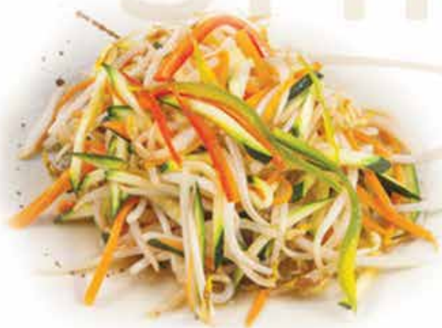
230. Misto verdure saltate 🌿 allergeni: 6