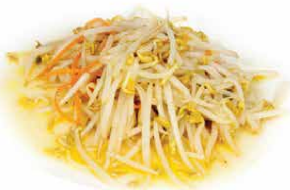
231. Germogli di soia saltati 🌿 allergeni: 6