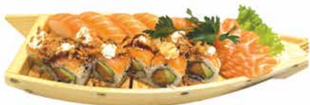
306. Barca solo salmone 35 pz € 28,00 (nigiri, uramaki, sashimi)