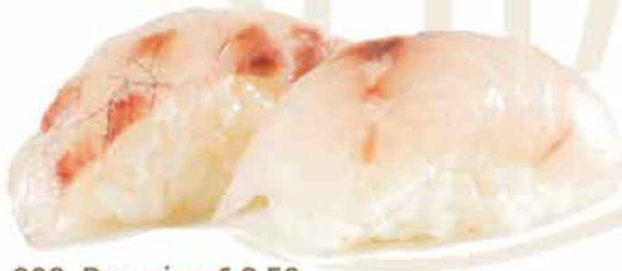
302. Branzino € 3,50 allergeni: 1,4