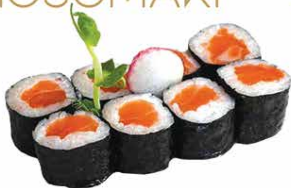
362. Hosomaki salmone 8 pz € 4,00 allergeni: 4