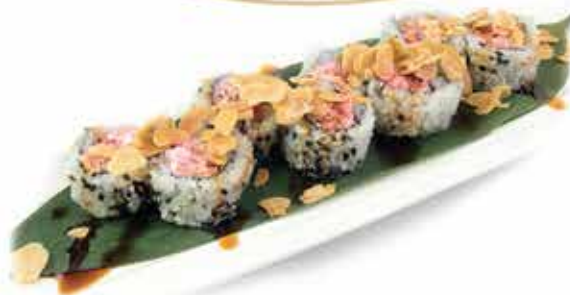
379. Uramaki star roll € 10,80 (salmone, philadelphia, teriyaki, scaglie di mandorle) 8 pz allergeni: 1,4,6,7,8,11