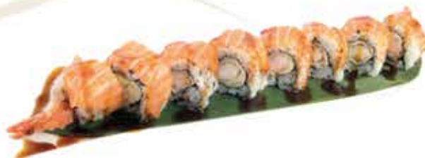
383. Tiger roll € 12,00 (gamberi in tempura, insalata, maionese, guarnito con salmone, teriyaki) 8 pz allergeni: 1,2,3,4,6,11*