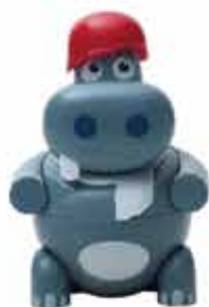
Hip Pop Gelato alla fragola € 5.00