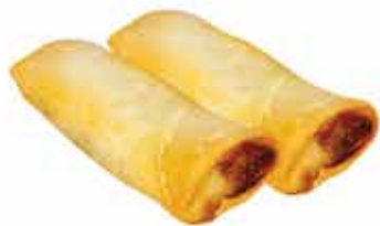
6. Harumaki 🌱 € 2,50 (involtino primavera con verdure miste 2 pz) allergeni: 1*