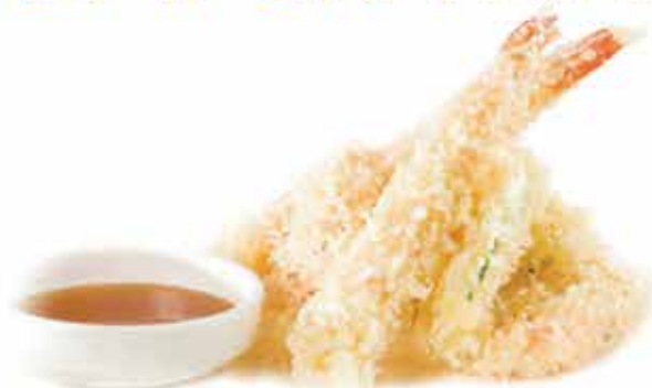
180. Tempura moriawase € 10,80 (gamberoni e verdure miste fritte) allergeni: 1,2,3*