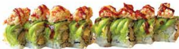
392. Ebiten plus € 12,80 (gamberi in tempura, guarnito da tartare di granchio, strutto, avocado e teriyaki) 8 pz allergeni: 1,2,6,11*