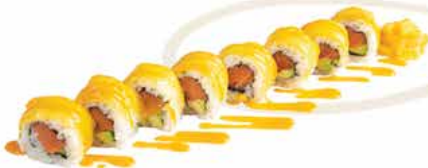
374. Mango roll € 8,00 (salmone, mango, philadelphia, salsa mango) 8 pz allergeni: 4,7,11