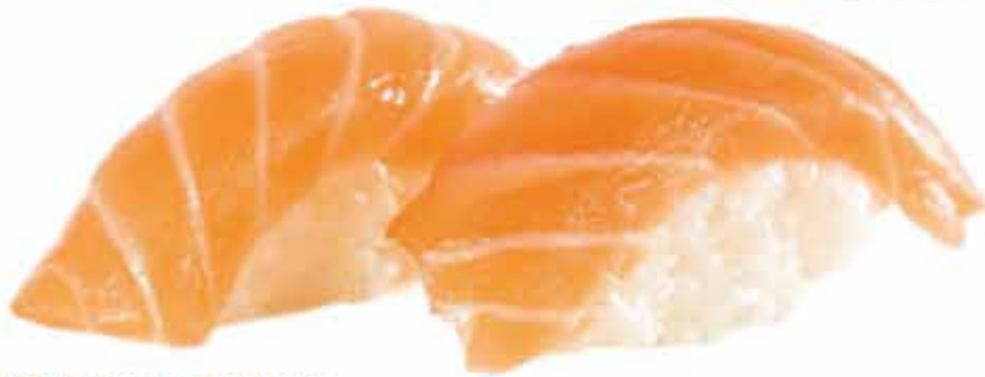
300. Salmone € 3,50 allergeni: 1,4