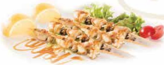
195. Spiedini di seppie 4pz € 8,50 allergeni: 14*