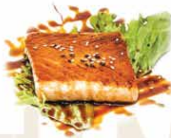
193. Salmone alla piastra con salsa teriyaki € 13,00 allergeni: 4,6