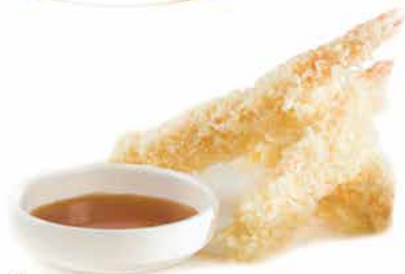
181. Ebi tempura € 12,00 (gamberoni fritti) allergeni: 1,2,3*