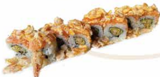
387. Mexx roll € 12,00 (gamberi in tempura, ricoperto con salmone, nachos, e salsa messicana) 8 pz allergeni: 1,2,4,11*