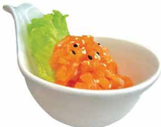
341. Tartara salmone in salsa ponzu € 10,00 allergeni: 1,4,11