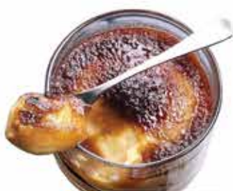
Coppa crema catalana € 5.90