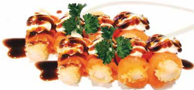
326. Involtino sake ebi ( 8 PZ) € 10,00 (gambero in tempura, avvolto da carpaccio di salmone, philadelphia teriyaki) allergeni: 1,2,4,6,7*