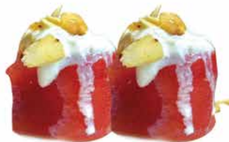
334. Gunkan burrata € 5,00 (tonno teriyaki, mandorle, burrata di stracciatella) allergeni: 1,4,7,8,11