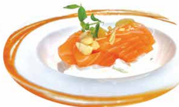
91. Sashimi burrata (17pz) € 18,00 (salmone, mandorle tostate, teriyaki e stracciatella di burrata) allergeni: 4,7,8