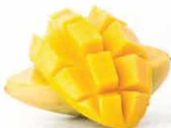
Mango fresco € 5.00