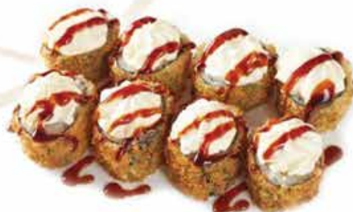
360. Maki fritto philadelphia € 7,00 (salmone, teriyaki, philadelphia) 8 pz allergeni: 1,4,6,7,11