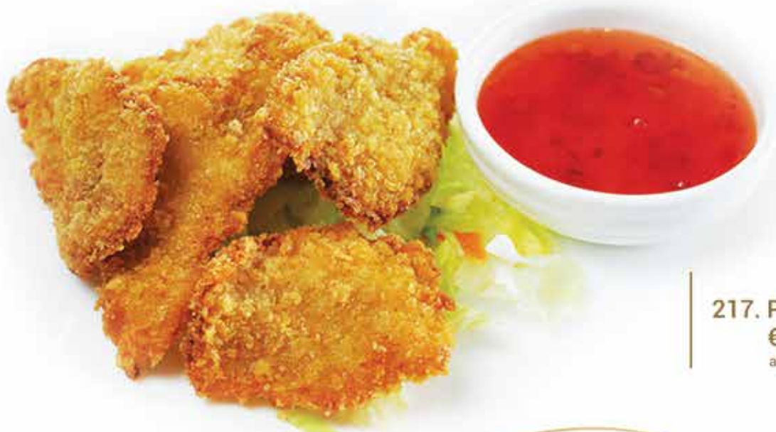
217. Pollo fritto € 9,80 allergeni: 1,3*