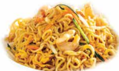
166. Chicken Ramen € 6,80 (con pollo e verdure) allergeni: 1,3