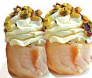
330. Gunkan scottato € 4,00 (salmone scottato, philadelphia, pistacchio, teriyaki) allergeni: 1,4,7,6,8,11