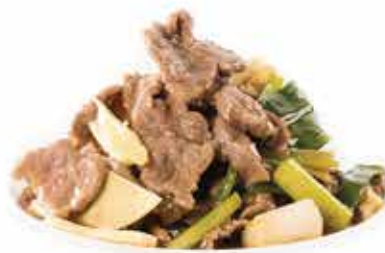
224. Manzo con zenzero e cipollotti € 10,80 allergeni: 1,6*