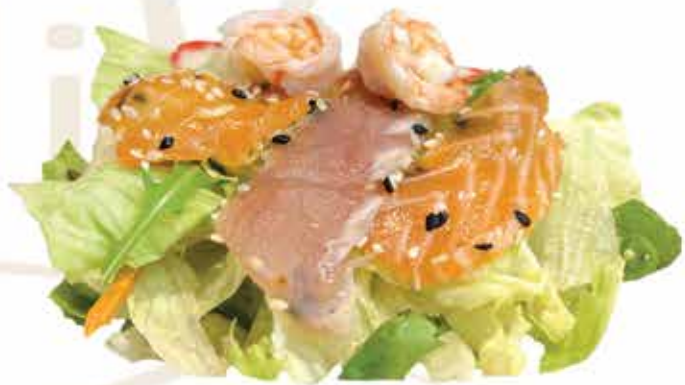
24. Rainbow salad € 7,50 (insalata mista con pesce misto e salsa sesamo) allergeni: 2,6,9,11