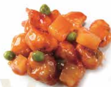
214. Pollo in agrodolce € 8,50 allergeni: 1,6*