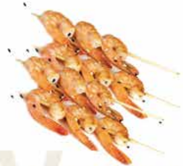
194. Spiedini di gamberi 4pz € 8,50 allergeni: 2*