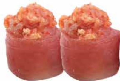
328. Gunkan spicy tuna) € 4,00 allergeni: 4,11