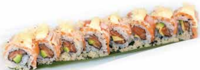
384. Tataki roll € 12,00 (salmone, avocado ricoperto da salmone scottato, salsa spicy mayo, tempura croccante e teriyaki) 8 pz allergeni: 1,2,3,4,11