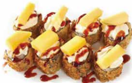
368. Maki fritto mango € 8,80 (salmone, philadelphia, mango fresco, salsa al mango) 8 pz allergeni: 1,4,7,11