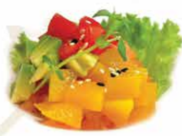
345. Tropical tartara (salmone, avocado, mango fresco, passion fruit e salsa ponzu) € 12,00 allergeni: 1,4