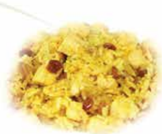
176. Riso al curry con pollo e verdure