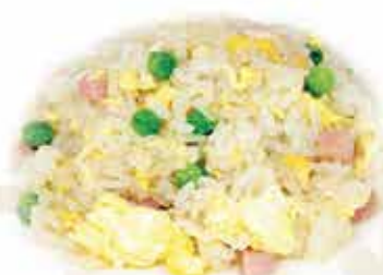
172. Riso cantonese