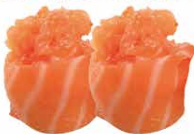
327. Gunkan spicy salmon) € 4,00 allergeni: 4,11