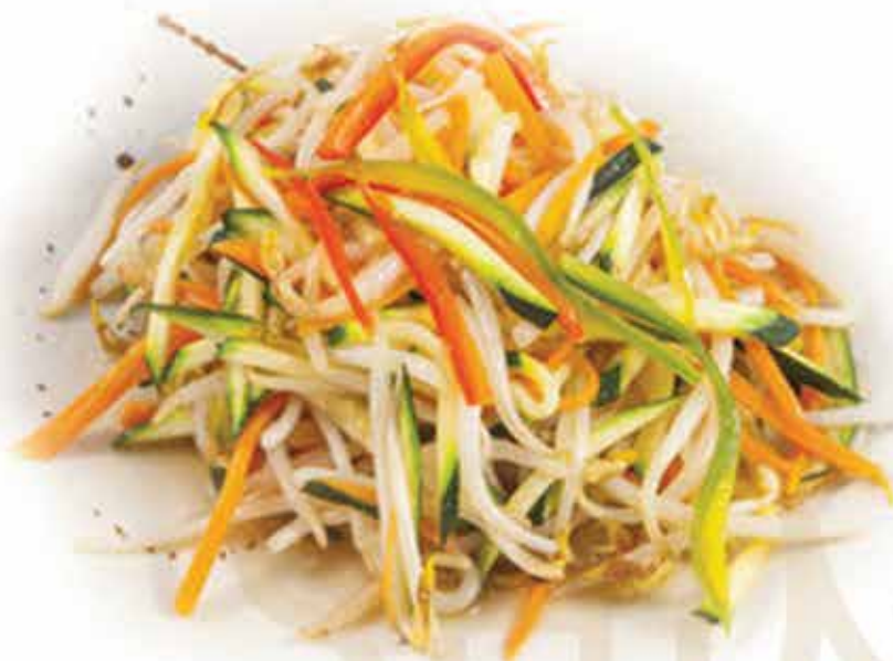
230. Misto verdure saltate 🌱 € 6,00 allergeni: 6