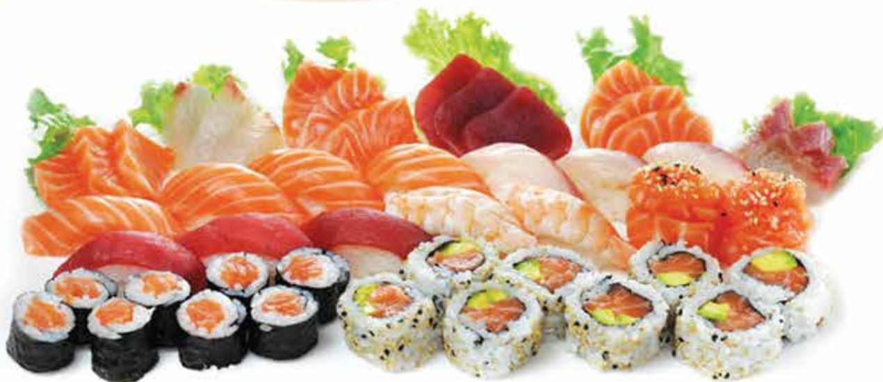
310. Sushi party 30 pz € 29,90 (nigiri, uramaki, gunkan, sashimi)