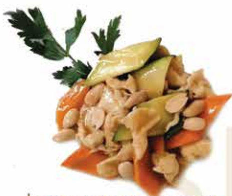
211. Pollo alle mandorle e verdure € 8,50 allergeni: 1,8*