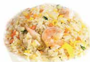
173. Riso saltato con gamberi e verdure