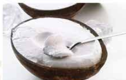
Cocco ripieno € 5.50