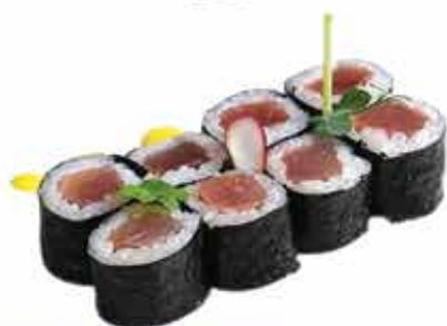
363. Hosomaki tonno 8 pz € 4,50 allergeni: 4