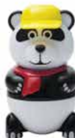
Pan Dan Gelato al gusto vaniglia € 5.00