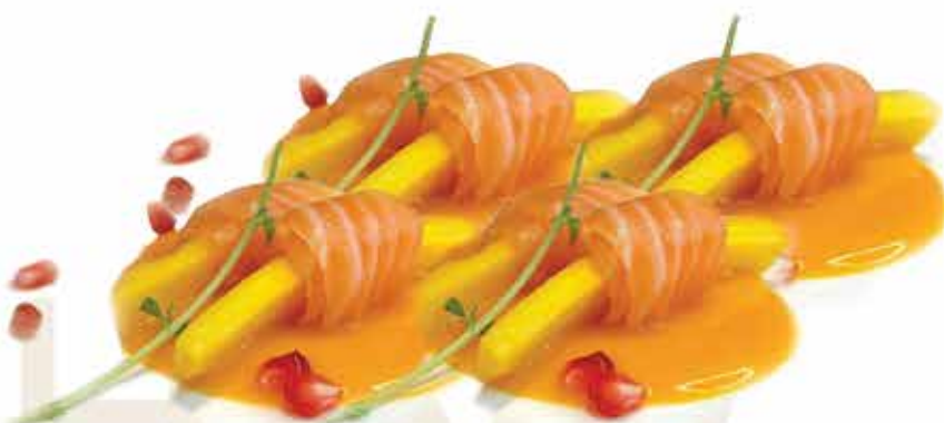
325. Involtini di mango (8 PZ) € 10,00 (mango fresco avvolto da carpaccio di salmone e salsa mango) allergeni: 4