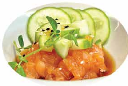
342. Tartara citrus € 10,00 (salmone, cucumber, salsa citrus) allergeni: 4,6