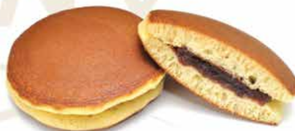
Dorayaki della casa