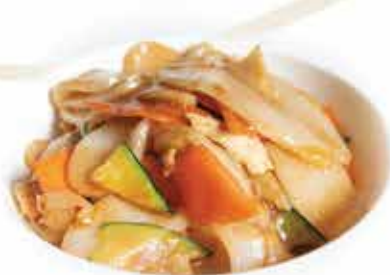
175. Gnocchi di riso con gamberi e verdure