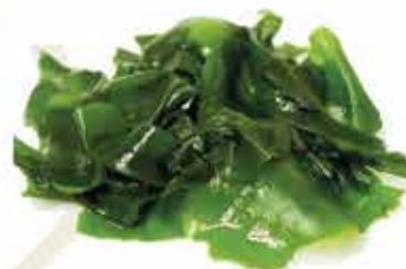
11. Wakame 🌱 € 4,00 (alghe morbide in salsa sesamo) allergeni: 1,9,11