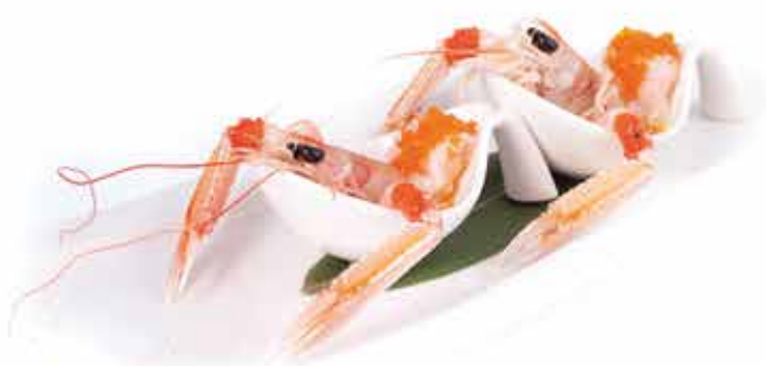
319. Scampi alla passion fruit (5pz) € 17,00 allergeni: 1,2*