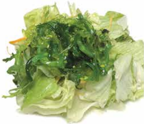
20. Crunch Salad € 5,00 (insalata mista, alghe, goma wakame, salsa sesamo) allergeni: 6,9,11