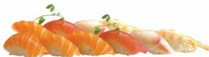
307. Sushi misto nigiri 10 pz € 11,00 (salmone, tonno, branzino, gambero cotto)