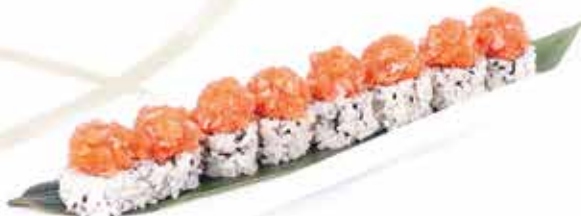
388. Uramaki spicy salmon € 10,80 (tartare di salmone piccante) 8 pz allergeni: 1,4,11