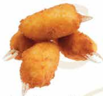
9. Chele di granchio 4pz € 4,80 allergeni: 1,2*