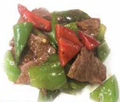
222. Manzo saltato con cipolla e peperoni € 10,80 allergeni: 1,6*