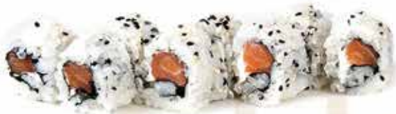
371. Uramaki philadelphia € 8,00 (salmone, philadelphia) 8 pz allergeni: 4,7,11