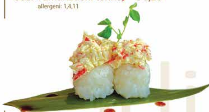
337. Tamarizushi crab € 3,20 allergeni: 1,2,11*