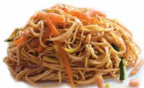
161. Teriyaki udon € 7,50 (spaghetti di grano con salmone e verdure) allergeni: 1,4,3