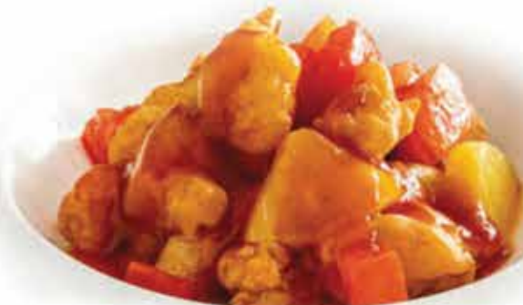
210. Maiale in agrodolce € 7,50 allergeni: 1*