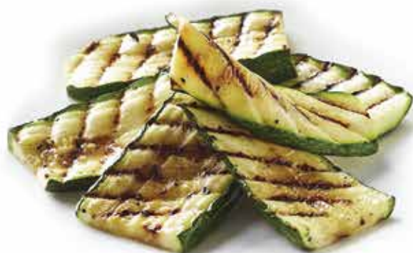
232. Zucchine alla griglia 🌱 € 6,00