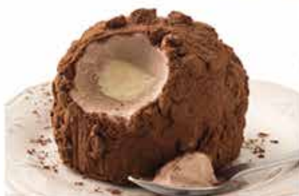
Tartufo nero € 5.00