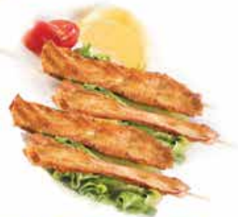
199. Spiedini di pollo alla piastra 4pz € 6,50