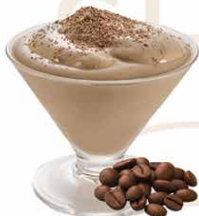
Sorbetto al caffè