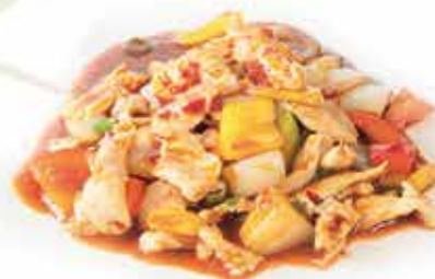
220. Pollo spicy € 8,50 allergeni: 1,6*