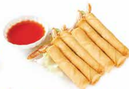
8. Samurai stick € 6,80 (stick di gamberi avvolti da pasta filo 6 pz) allergeni: 1,2*