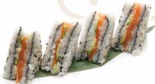
382. Uramaki sandwich € 9,00 (salmone, philadelphia, avocado, teriyaki, tempura croccante) 4 pz allergeni: 1,4,6,7,11