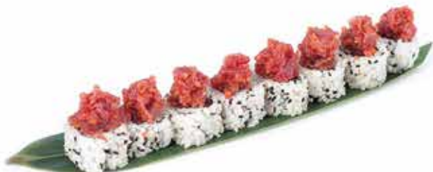
389. Uramaki spicy tuna € 10,80 (tartare di tonno piccante) 8 pz allergeni: 1,4,11