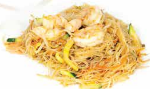
165. Spaghetti di riso con gamberi e verdure € 6,80 allergeni: 1,2,3