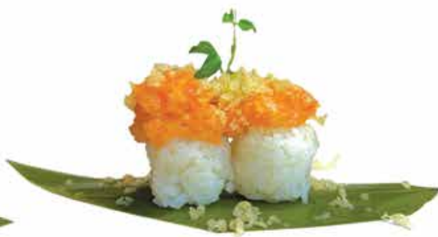
336. Tamarizushi salmone) € 3,20 allergeni: 1,4,11