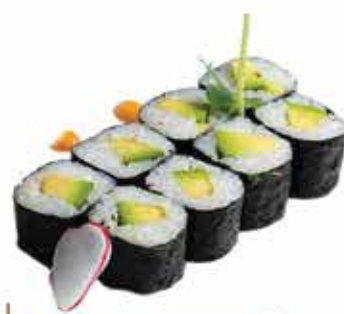
365. Hosomaki avocado 8 pz € 4,00