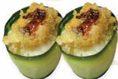
331. Gunkan zucchini ebi € 4,00 (zucchina scottato, teriyaki, tempura di gamberi) allergeni: 1,2,6,11