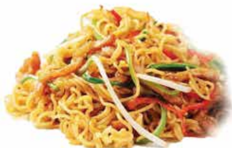
163. Spicy Ramen € 6,80 (pollo, verdure e salsa piccante) allergeni: 1,3