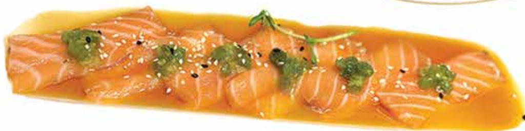
324. Carpaccio citrus € 15,00 (Carpaccio di salmone, wasabi fresco, salsa citrus) allergeni: 4,6,11