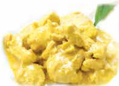
215. Pollo al curry € 8,50 allergeni: 1*