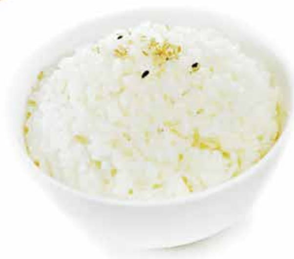
170. Riso bianco € 2,50