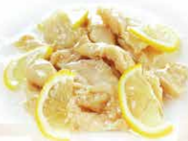
213. Pollo al limone € 8,50 allergeni: 1*