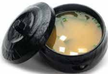
25. Zuppa di miso € 3,50 (alghe, tofu, erba cipollina) allergeni: 6