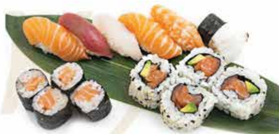
309. Sushi misto piccolo 13 pz € 11,00 (nigiri, uramaki, hosomaki)