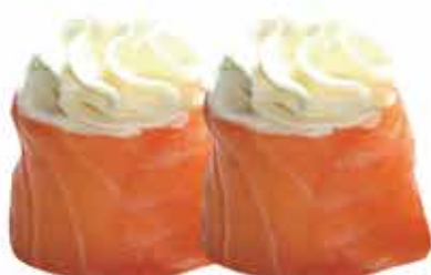
329. Gunkan philadelphia € 4,00 allergeni: 4,7