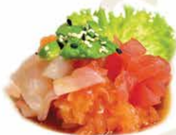
343. Tartara triple € 12,00 (salmone, tonno, branzino, avocado, salsa ponzu) allergeni: 1,4,6,11