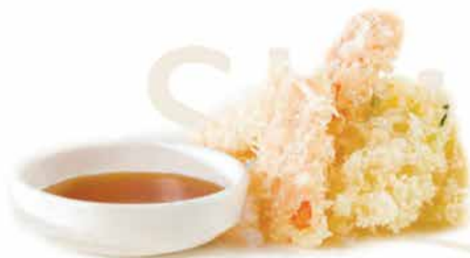
182. Yasai tempura € 9,00 (verdure miste fritte) allergeni: 1,3