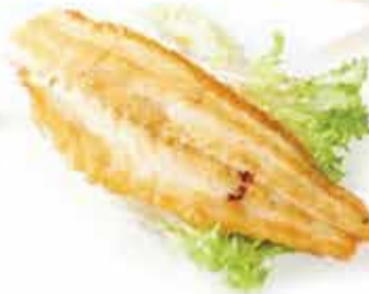
198. Branzino alla griglia € 13,00 allergeni: 4