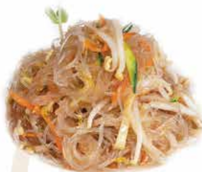
162. Spaghetti di soia € 5,80 con verdure miste allergeni: 1,6