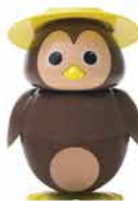
Cip Ciok Gelato al cioccolato € 5.00