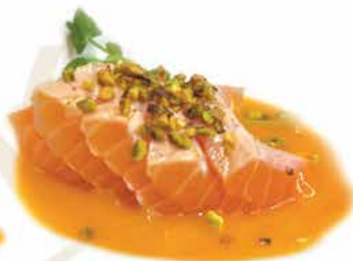
317. Sashimi flambè (17pz) € 15,00 (salmone scottato in salsa mango e pistacchio) allergeni: 4,8