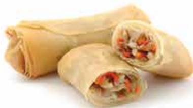
7. Involentino giapponese (con ripieno di gamberi 2 pz) € 5,50 allergeni: 1,2*