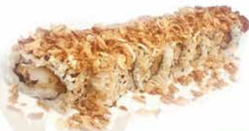
381. Uramaki ebiten special € 9,00 (gamberi fritti, philadelphia, cipolla croccante, teriyaki) 8 pz allergeni: 1,2,6,7,11*