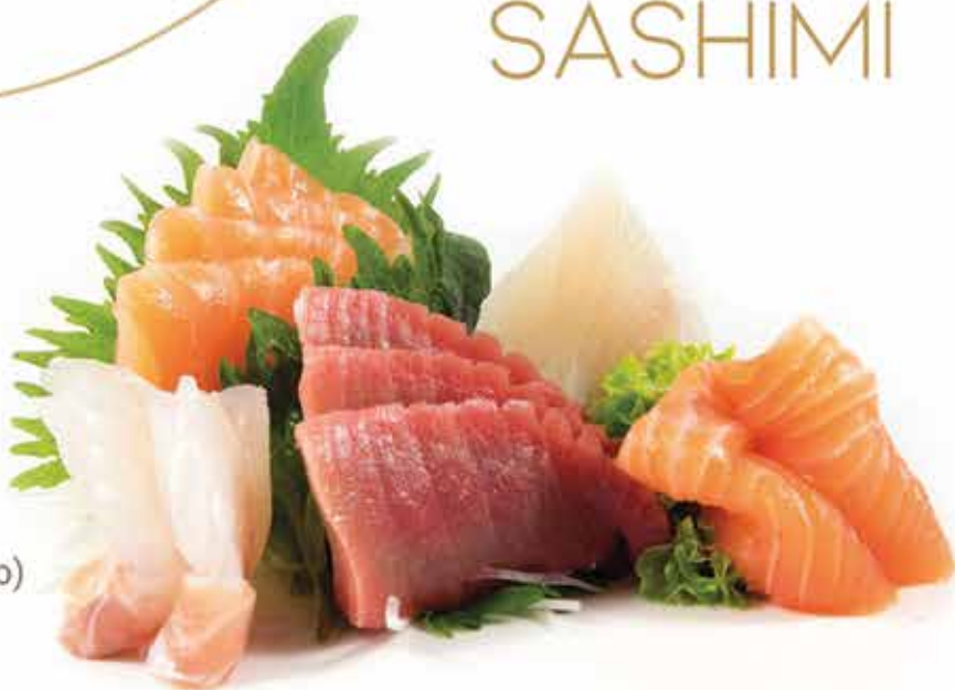
315. Sashimi misto (17pz) € 15,00 (salmone, tonno, branzino) allergeni: 4