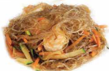
164. Spaghetti di soia con gamberi e verdure € 6,80 allergeni: 1,2,3,6