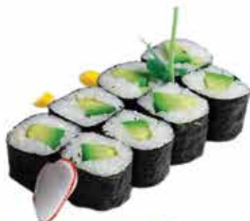
364. Hosomaki cetriolo 8 pz € 4,00