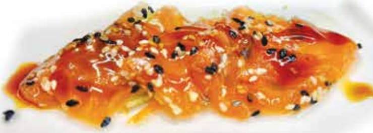
190. Salmon tataki € 13,80 (salmone scottato in crosta al sesamo, teriyaki e lime) allergeni: 1,4,11