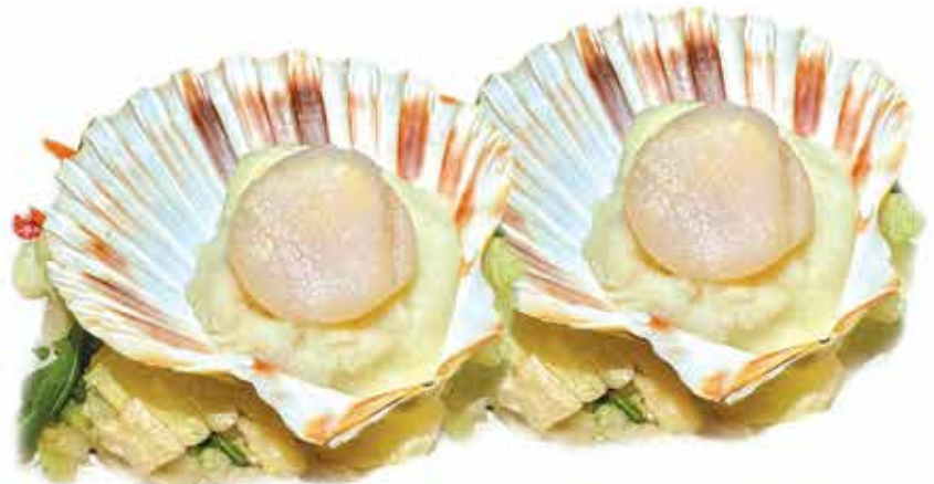
196. Capesante alla shiny con purea di patate 2pz € 12,00 allergeni: 7,14*