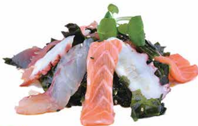
12. Wakame moriwase € 7,00 (alghe morbide ricoperto di pesce) allergeni: 1,2,9,11,14