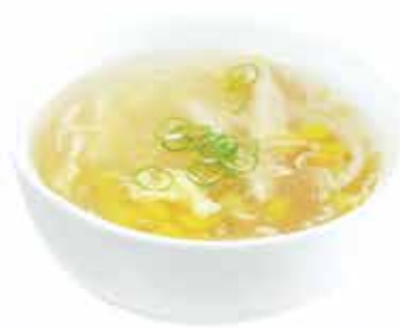
26. Zuppa mais e Pollo € 4,80 (pollo, mais, uova) allergeni: 3