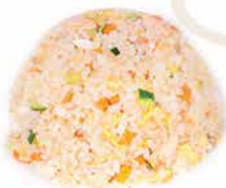
174. Riso saltato con salmone e verdure