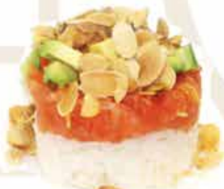
344. Tartara speciale (riso, salmone, avocado, teriyaki, mandorle tostate) € 10,00 allergeni: 1,4,6,8,11