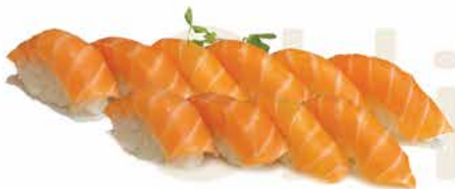
308. Sushi sake 10 pz € 11,00 (nigiri solo salmone)