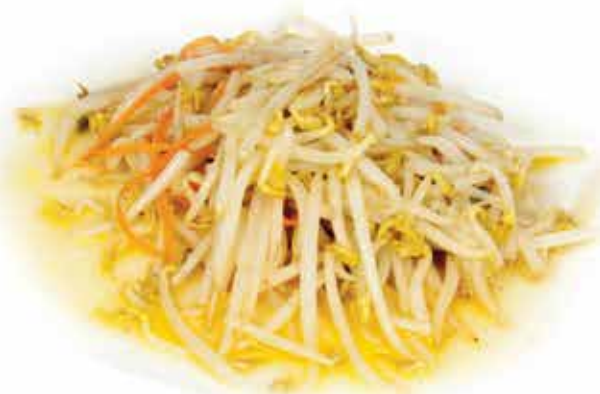
231. Germogli di soia saltati 🌱 € 6,00 allergeni: 6