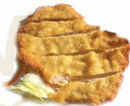
184. Cotoletta impanata € 8,00 allergeni: 1,3