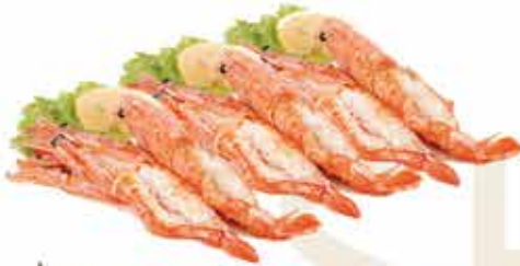
192. Gamberoni Argentini alla piastra 6pz € 15,00 allergeni: 2*