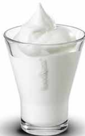
Sorbetto di riso