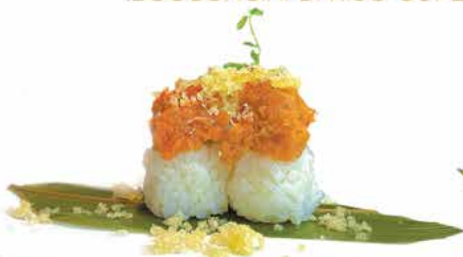
335. Tamarizushi tonno) € 3,20 allergeni: 1,4,11

(BOCCONCINI DI RISO COPERTO DA PESCE E TEMPURA 2 PZ)