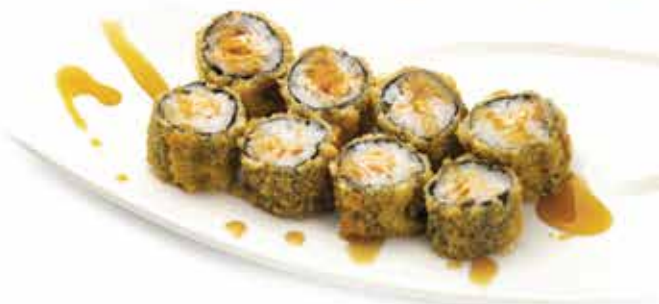
366. Hosomaki Fritto salmone € 6,00 (salmone, teriyaki) 8 pz allergeni: 1,4,6,7,11