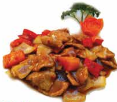
223. Manzo spicy € 10,80 allergeni: 1,6*