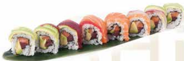
380. Rainbow roll € 12,00 (salmone, avocado, guarnito con misto di pesce) 8 pz allergeni: 1,4,11