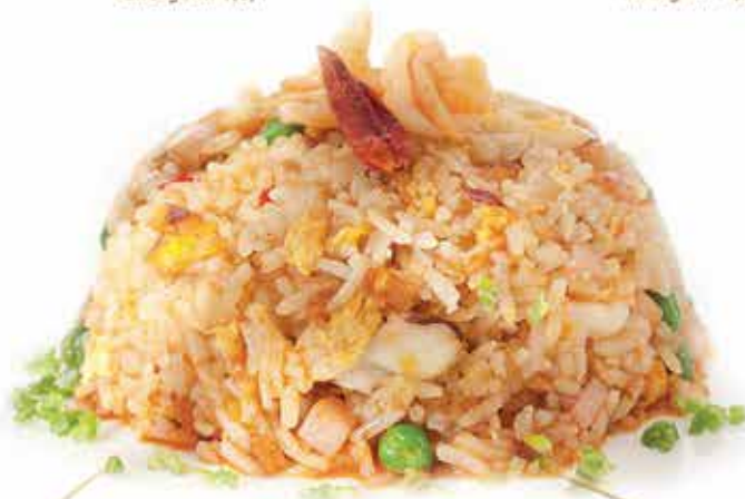
177. Riso alla pechinese ) (pollo, verdure, salsa piccante)