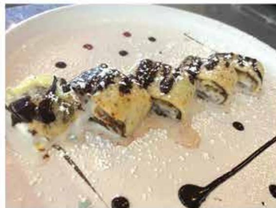
Crep alla nutella con gelato di riso € 5.50 (home made)