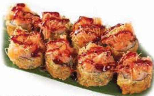
367. Maki fritto spicy € 8,80 (salmone, guarnito con salmone piccante) 8 pz allergeni: 1,4,11