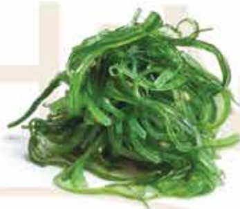
10. Goma wakame 🌱 (alghe croccanti leggermente piccanti) € 5,00 allergeni: 11*