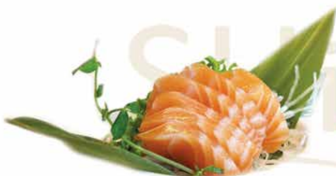
316. Sashimi salmone (17pz) € 13,00 allergeni: 4