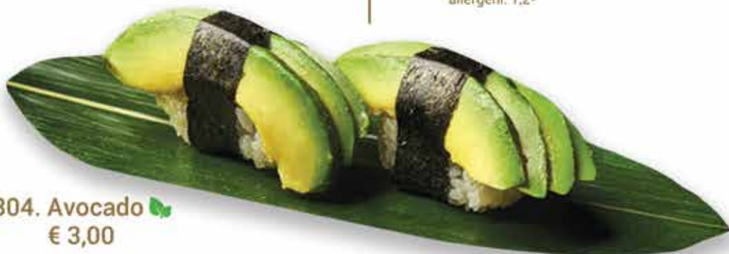
304. Avocado 🥑 € 3,00