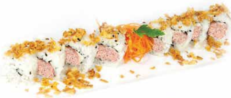
385. Miura crunch € 8,50 (salmone cotto, philadelphia, teriyaki, spicy mayo e granella di tempura) 8 pz allergeni: 1,4,6,7,11