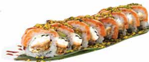
386. Super salmon roll € 11,80 (salmone alla griglia, philadelphia, guarnito con salmone, teriyaki e granella di pistacchio) 8 pz allergeni: 1,4,6,7,8,11