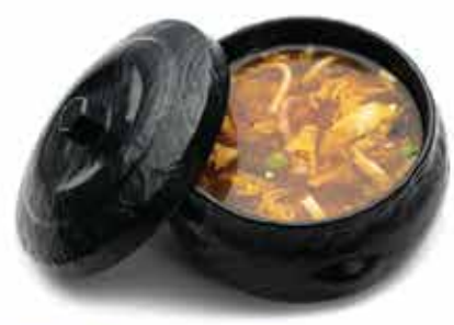
27. Zuppa pechinese € 4,80 (funghi, alghe, tofu, uovo, salsa agropiccante) allergeni: 1,3,6