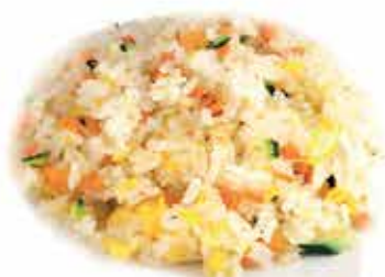
171. Riso saltato alle verdure € 5,00