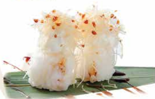
338. Tamarizushi philadelphia € 3,20 allergeni: 1,7,113