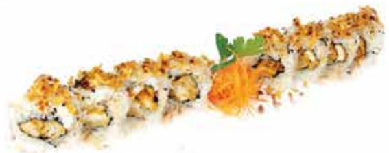
377. Chicken roll € 8,00 (pollo fritto, insalata, spicy mayo) 8 pz allergeni: 1,3