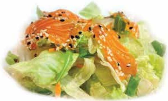
21. Shiromi salad € 7,50 (insalata mista con salmone, avocado e salsa sesamo) allergeni: 9,6,11