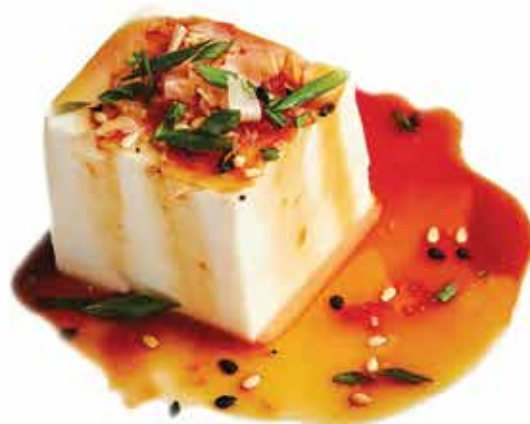
13. Tofu fresco in salsa ponzu 🌱 € 5,00 allergeni: 1,6