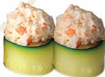
332. Gunkan zucchini crab € 4,00 (zucchina scottato, polpa di granchio, allergeni: 1,2,11