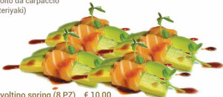
101. Involtino spring (8 PZ) € 10,00 (avocado avvolto da carpaccio salmone e salsa sesamo) allergeni: 4,11