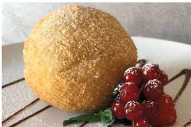
Gelato fritto gelato crema

(popolare dolcetto giapponese, formato da un impasto morbido simile al pancake farcita alla nutella)