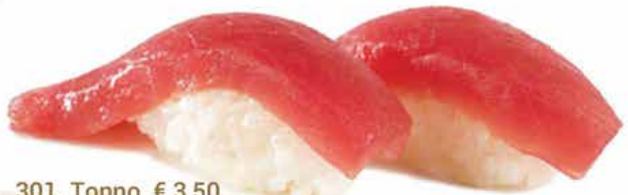
301. Tonno € 3,50 allergeni: 1,4