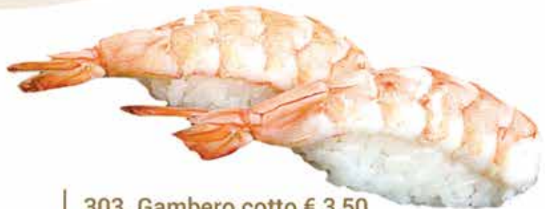
303. Gambero cotto € 3,50 allergeni: 1,2*