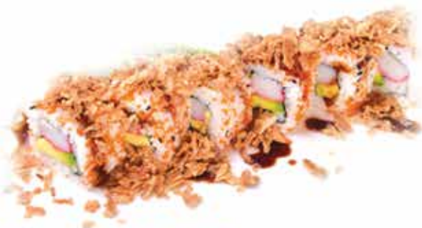
378. Crunch roll € 9,00 (granchio, avocado, maionese, cipolla croccante) 8 pz allergeni: 1,2,3,11