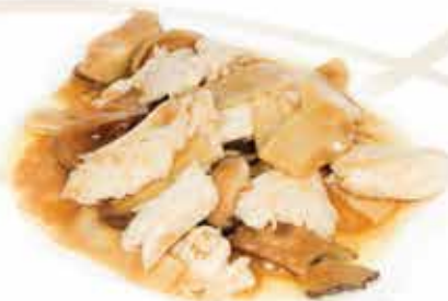
216. Pollo con bambù e funghi € 8,50 allergeni: 1,6*